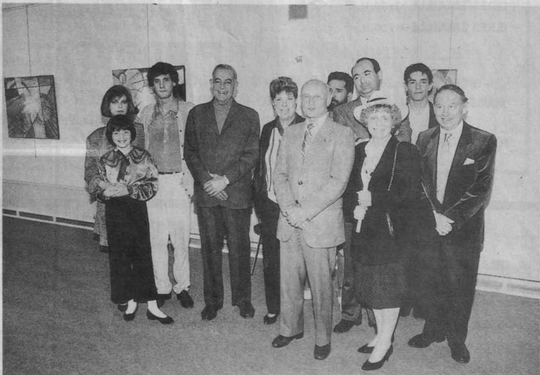
De nombreux invités autour de M. Chevalier.

Un passage au centre culturel de Fréjus s'impose.